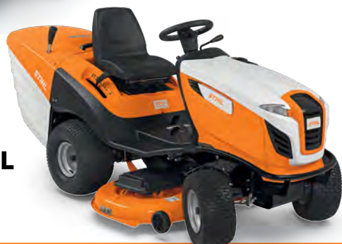
RT 6127 ZL

RT 4082 ΑΠΟ 3.749€ | 2.990€ • Πλ. κοπής: 80cm, • Ύψος: 35-90mm • Έκταση: έως 4.000m 2 • Πλαστικός κάδος: 250lt.