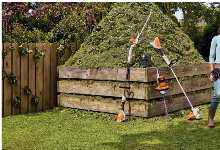
Βάρος χωρίς μπαταρία.